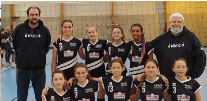
L'équipe M15 victorieuse à l'issue du 1 er tour de coupe de France