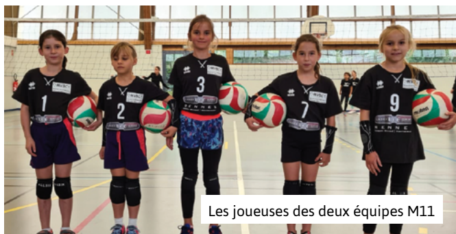
Les joueuses des deux équipes M11

Nous avons eu la chance de retrouver le chemin de nos activités de sports et de loisirs en septembre, restons optimistes pour l'avenir !