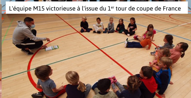
Futurs champions en herbe ? Cours multisports de l'OSM