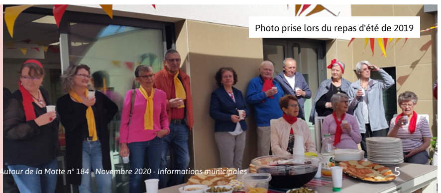
Photo prise lors des repas d'été de 2019