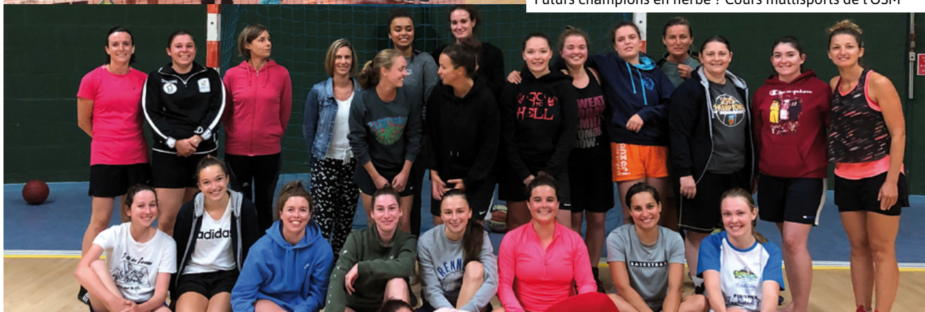
Une représentation très féminine du BCM !