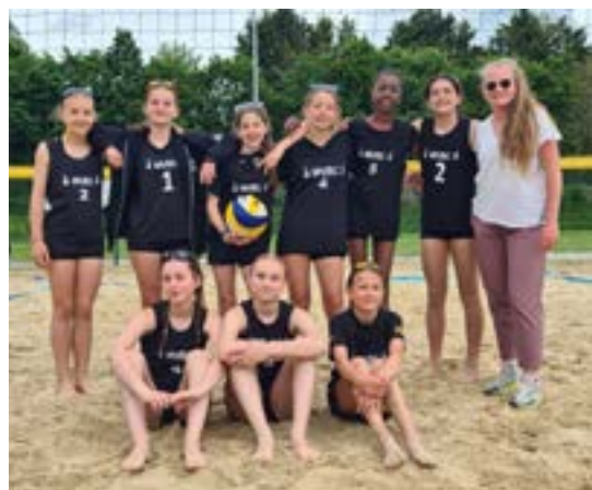
Les équipes M13F lors du 1 er tour de la coupe de France à Montgermont

Les M13 Masculins ont joué les interzones à Laval le 15 juin. Les rencontres se sont jouées au tie-break mais malheureusement ils ne se qualifient pas pour les finales France. Quant aux M13 féminines, en déplacement à Houlgate, elles ont remporté leurs deux matchs face à l'équipe d'Evreux VB et filent en finale de Coupe de France du 5 au 7 juillet à Chateauroux.