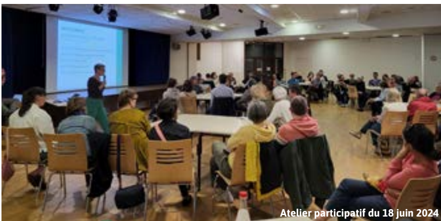
Atelier participatif du 18 juin 2024

"Dans les prochains mois, de nouvelles réunions publiques et ateliers de travail seront organisés. Les dates continueront d'être communiquées sur l'ensemble de nos outils de communication communaux. Si vous n'avez pas pu, jusqu'à présent, apporter votre contribution l'adresse mail mise en place dès le début de cette concertation est toujours accessible (renouvellement-urbain@ville-montgermont.fr). Nous vous invitons à venir aux ateliers et à relire les comptes rendus afin de bénéficier d'une information fiable et transparente."