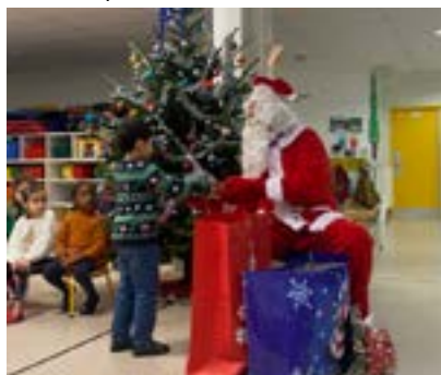
Autour de la Motte n° 226 - Janvier 2025

Avant de partir en vacances, un grand goûter rassemblant tous les élèves a été organisé pour accueillir le Père-Noël en personne.