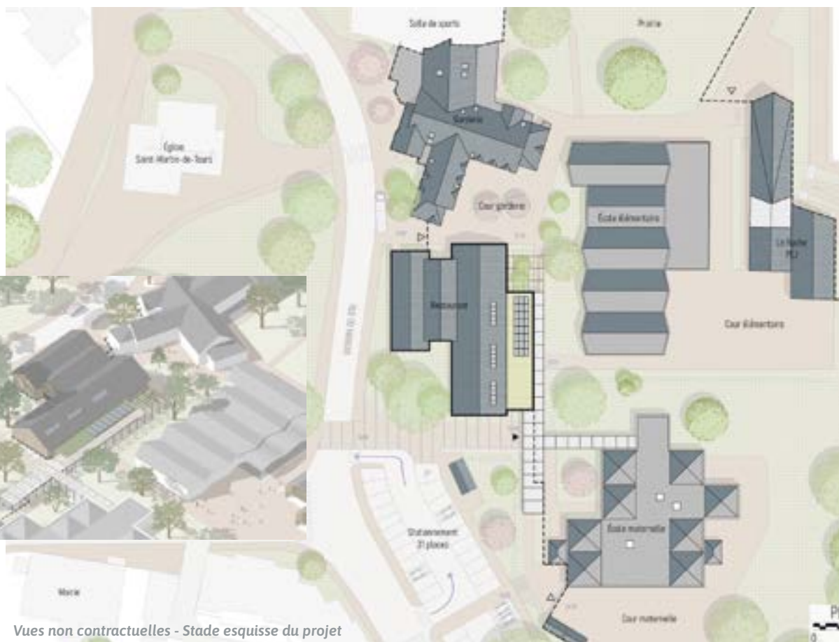
Vues non contractuelles - Stade esquisse du projet